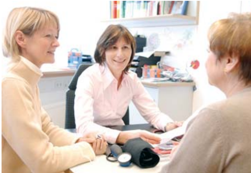
Auch bei den neuen Kooperationen der Bosch BKK erhalten Arzt und Patient Unterstützung durch die BKK-Patientenbegleiter

Patienten mit einer psychischen Erkrankung stehen im Mittelpunkt einer neuen Kooperation mit der saarländischen Bliestalklinik. Sie sollen innerhalb kurzer Zeit an einen Facharzt der Klinik vermittelt werden, um die teilweise mehrere Monate dauernde Wartezeit für eine Psychotherapie zu überbrücken. Durch kurzfristige Hilfen soll die gesundheitliche Situation des Patienten so weit stabilisiert werden, dass zum Beispiel eine Krankenhauseinweisung vermieden werden oder der Patient seine Arbeit wieder aufnehmen kann. Im Juli startet außerdem eine Kooperation mit dem Klinikum Kempten, den Kliniken Oberallgäu und dem Hausarztverein