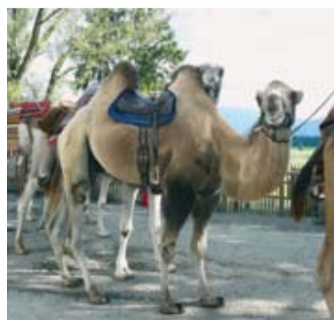
Hauptgewinn der Treuebonus-Verlosung „G-win junior“: Kamelreiten als Familien-Event

Austoben im Sportverein, regelmäßige Untersuchungen beim Kinder- und Zahnarzt oder Gesundheitsaktionen