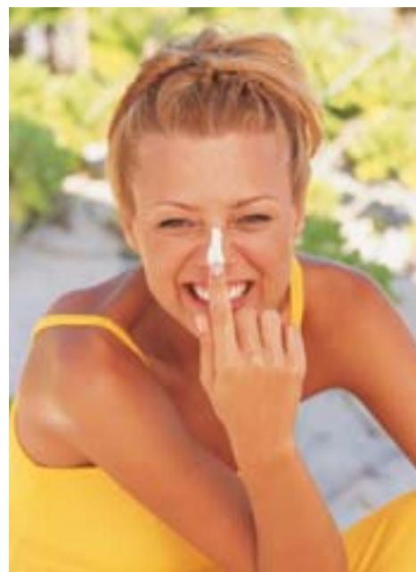
Beim Eincremen besonders auf „Sonnenterassen“ wie Ohren und Nase achten

Sonnenstrahlen in begrenztem Umfang sind wichtig für unsere Gesundheit, denn sie ermöglichen dem Körper z. B. erst, die für die Knochenbildung wichtigen Vitamine D1 und D2 zu bilden. Als Schutz vor zu intensiver Sonneneinstrahlung bildet die Haut eine Pigmentierung (Bräunung), mit deren Hilfe die UV-A-Strahlung und die energiereichere UV-B-Strahlung bereits in den obersten Hautschichten abgeblockt werden. Ist