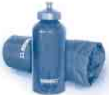
eine Sigg-Flasche inkl. Thermobag