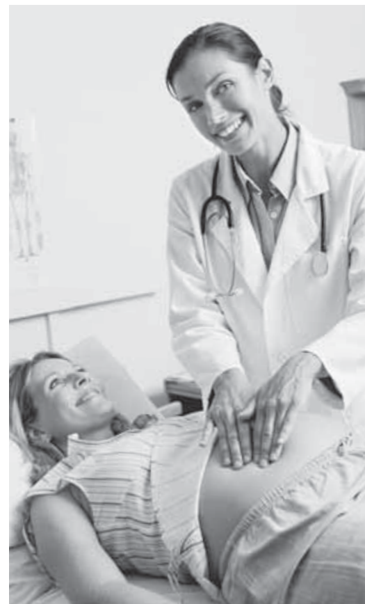
In gesunden Tagen und im Krankheitsfall: Die Bosch BKK unterstützt Sie in jeder Lebenssituation

Egal, welches Alter oder welche Lebenssituation – Gesundheitsvorsorge geht alle an . Deshalb unterstützt die Bosch BKK die Teilnahme an qualitätsgeprüften Gesundheitskursen mit einem Zuschuss von bis zu 100 % der Kurskosten (max. 80 EUR). Ob Herz-Kreislauf-Training, Ernährungsberatung für Übergewichtige oder Nordic Walking: Sie profitieren nicht nur durch den BKK-Zuschuss. Sie können sich die Teilnahme auch beim Bonusprogramm „G-win“ anerkennen lassen, mit dem die Bosch BKK gesundheitsbewusstes Verhalten belohnt.