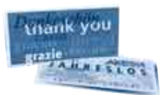
ein Jahreslos der „Aktion Mensch“