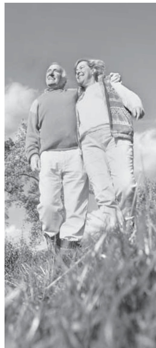
Bewegung an der frischen Luft hält gesund und mobil – auch in höherem Alter

Wie diese Beispiele zeigen, kann jeder selbst etwas zur Vermeidung von Stürzen tun. Überprüfen Sie doch einmal Ihre individuellen Sturzrisiken. Ist Ihr Wohnumfeld sicher gestaltet? Haben Sie Schwierigkeiten beim Aufstehen oder Balancestörungen? Nehmen Sie Medikamente, die die Wahrnehmung, die Koordinationsfähigkeit oder die Motorik beeinträchtigen können? Sprechen Sie mit Ihrem Arzt darüber. Der beste Schutz vor Stürzen im Alter aber ist immer noch ausreichende Bewegung. Deshalb unser Tipp: Jeden Tag einen Spaziergang machen, am besten mit Gleichgesinnten!