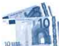
eine Geldprämie von 15 EUR